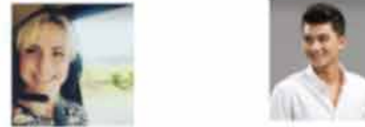
เป้าหมายหลัก 40-45 ปี เป้าหมายรอง 20-25 ปี