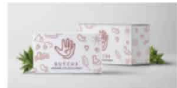
ภาพที่ 3 ซึ่