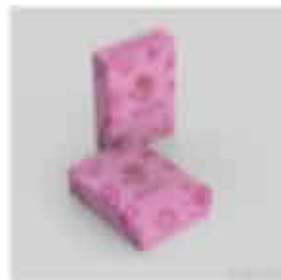
ภาพที่ 1-2 ซึ่