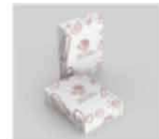
ภาพที่ 1-2 ซึ่