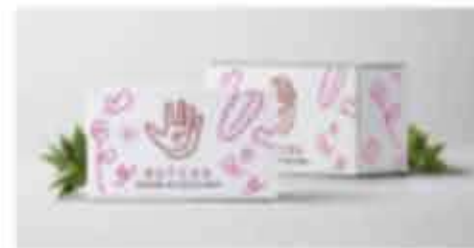
ภาพที่ 3 ซึ่