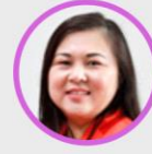
รศ.ดร.มัลลิกา เจริญสุธาสิทธิ์