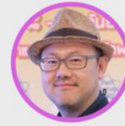
รศ.ดร.กฤษณะเดช เจริญสุธาสิทธิ์